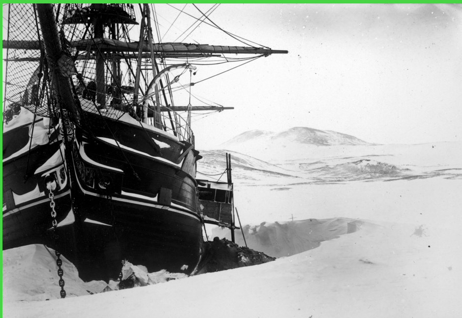
Loď Discovery sevřená ledem, 1901–1904, foto Reginald W. Skelton. Scott Polar Research Institute.